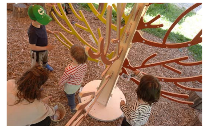
Stand au Festival Explore