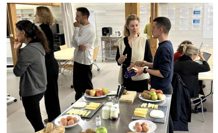
Ateliers participatifs pour un système alimentaire durable et territorial