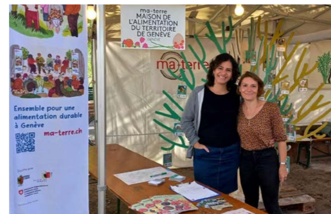
Stand lors de Festi'Terroir