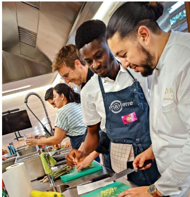
Atelier team building

12 ateliers alimentation durable team building ont été organisés durant l'année pour des entreprises et institutions publiques.