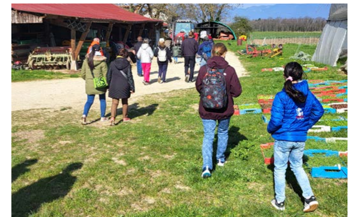
Visite immersive à la Ferme du Monniati