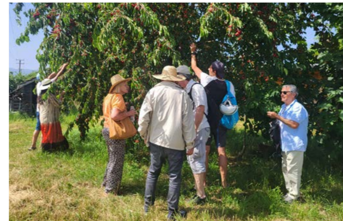
Visite immersive chez 1001 herbes