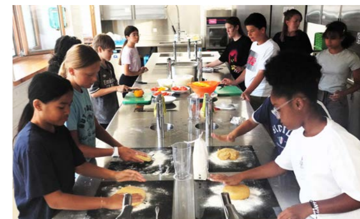
Atelier scolaire à la ferme de Budé