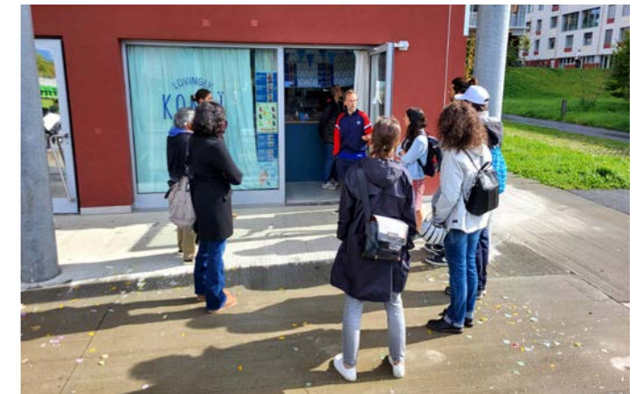
Visite immersive chez Konoï