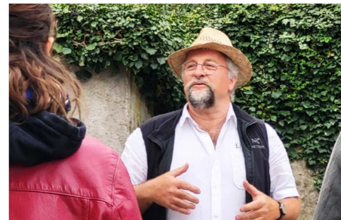
Visite immersive au Domaine de la Maison Forte