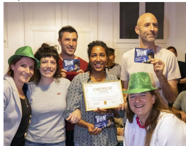
Pop quiz sur l'alimentation durable